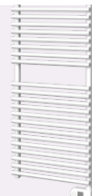
GILIA SINGLE E