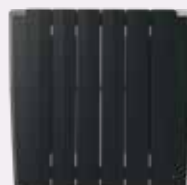
ALU SIMPLE FLUID FLUID Technologie aus Aluminium