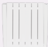
ALU SIMPLE DRY DRY STONE Technologie aus Aluminium