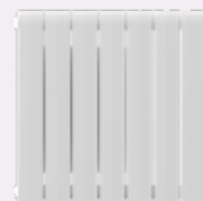
ALYNE FLUID Technologie aus Aluminium