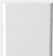
CLOUD DRY STONE Technologie aus Stahl

Sie haben die Wahl zwischen Produkten, die auf der Trockenträgheitstechnologie (DRY STONE Technologie) basieren. In diesem Fall erwärmt der Heizkörper die Luft in Ihrem Raum durch Konvektion auf angenehme und kontinuierliche Weise. Oder bevorzugen Sie eine ölfüllte Version (FLUID Technologie) mit kompakten vertikalen Säulen?